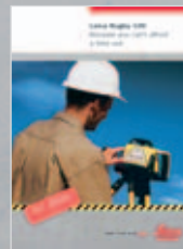
Leica Rugby 100 Le laser de construction robuste