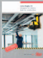
Leica Rugby 55 Le laser de construction polyvalent

R50 (Art. No.:753672): Classe laser 1 selon IEC 60825-1 et EN 60825-1