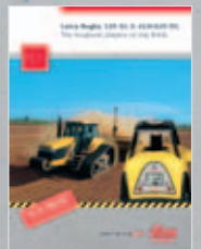
Leica Rugby 320SG & 410/420DG Les lasers à pente