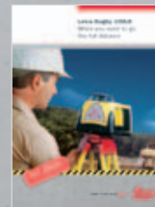
Leica Rugby 100LR Le laser de construction longue portée